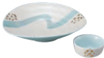
R287-286-39 パールスター流水楕円向付 18.8×17.5×4.8cm ¥2,550 R287-286-40 パールスター流水千代口 6.4×3.3cm ¥880