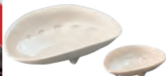
R287-29-22 志野備前あわび中鉢 17×12.5×H4cm ¥750 R287-29-21 志野備前あわび千代口 9.5×6.5×H3cm ¥300