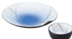
R287-286-43 コバルト銀彩 5寸皿 15.5×3.5cm ¥2,400 R287-286-44 コバルト銀彩 丸千代口 6.5×3cm ¥980