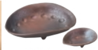
R287-28-24 紫備前あわび中鉢 17×12.5×H4cm ¥750 R287-28-23 紫備前あわび千代口 9.5×6.5×H3cm ¥300