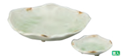
R287-300-12 笹みどり 三つ足刺身鉢 20.5×19×H4.5cm ¥1,040 R287-300-11 笹みどり 三つ足千代口 9×H2.6cm ¥320