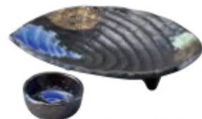
R288-290-3535 黒彩三色吹向付 22.3×15.3cm ¥3,000 502130135 R288-290-2336 黒彩三色吹千代口 6.6×3cm ¥1,120 502130235