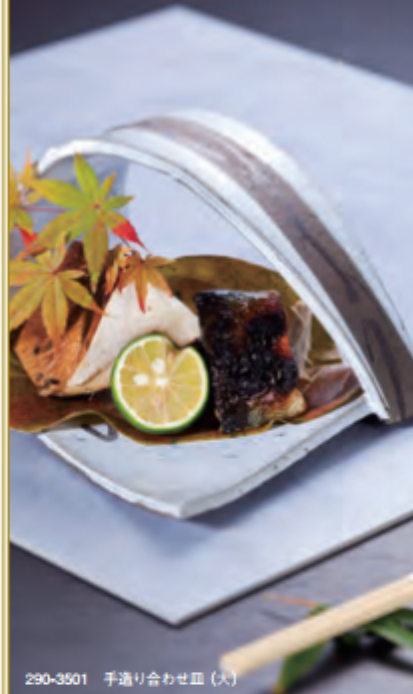
290-3501 手造り合わせ皿(大)