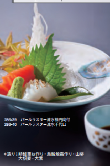
286-39 パールスター流水楕円向付 286-40 パールスター流水千代口