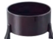
ABB.コレクション R288-290-9816 神楽三ツ足盛器 φ12.5×H8cm ¥2,600