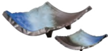
R287-304-01 森の湖瓦型刺身鉢 26×20×H6.7cm ¥1,600 R287-304-02 森の湖瓦型千代口 14×11×H3.5cm ¥420