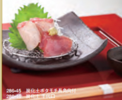
286-45 炭化土ボタモチ長角向付 286-46 炭化土千代口