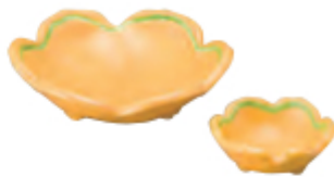
R287-286-41 黄釉グリーン梅形向付 15.6×4.6cm ¥2,150 R287-286-42 黄釉グリーン梅形千代口 8.2×3.1cm ¥850