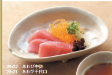
29-22 あわび中鉢 29-21 あわび千代口