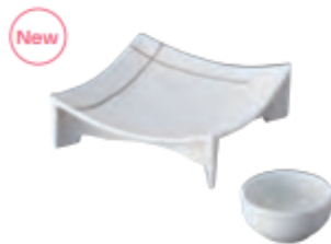
R288-290-3546 一珍白磁プラチナ線高台四方向付 14×14×4.6cm ¥2,500 9-401-358 R288-290-3547 白磁丸千代口 6.2×3.3cm ¥550 9-402-358