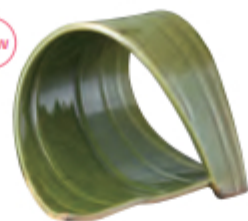
R288-290-3558 手造り合わせ皿(大) 織部 16.5×15.5×10.5cm ¥3,870