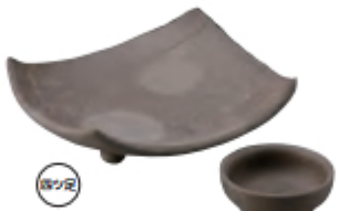
R287-286-45 炭化土ボタモチ長角向付 17.4×16×4.4cm ¥2,550 R287-286-46 炭化土千代口 6.8×2.6cm ¥720