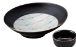
R288-290-3533 黒マット朱十草スローブ向付 16×15.5×5cm ¥1,700 700830735 R288-290-3534 黒マット湖金丸千代口 6.5×3cm ¥680 700830835