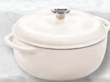
オイスターホワイト