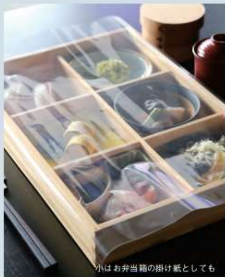
小はお弁当箱の掛け紙としても