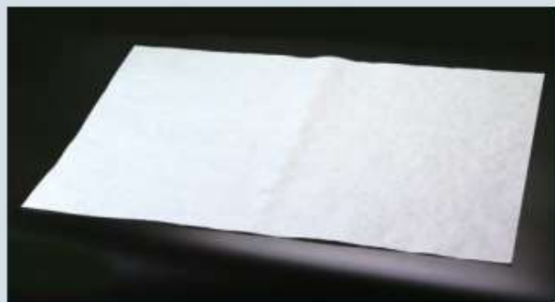
※名入れも承ります。別途お見積りいたします。

■ 抗菌加工製品の抗菌効果は、「JIS Z 2801」において抗菌活性値が2.0以上とすると定められています。