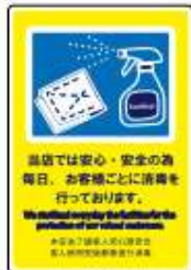
貼るサインシート AS-846