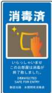
貼るサインシート AS-847