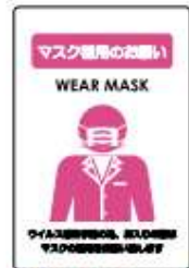
貼るサインシート AS-835 マスク着用