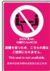
貼るサインシート AS-849