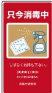
貼るサインシート AS-848