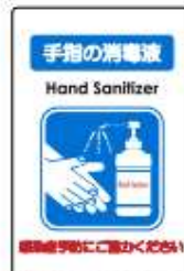
貼るサインシート AS-834 手指消毒液